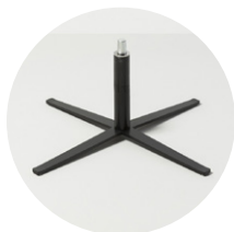
SB-700-N28 (fissaggio con piastra)