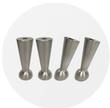
K8-900-000 (alluminio) M10 (x2 ant. + x2 post.)