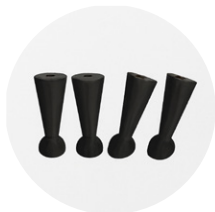
K8-900-0NE (neri) M10 (x2 ant. + x2 post.)