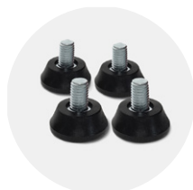
8CPI0101 M10 (x4 pz)