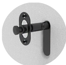
TB720200 (sistema di aggancio tra poltrone)