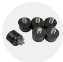
8CPI0720 M8 (x6 pz)