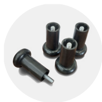
8CPI0005 M10 (x4 pz)