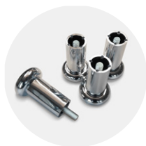
8CPI0005 M10 (x4 pz)